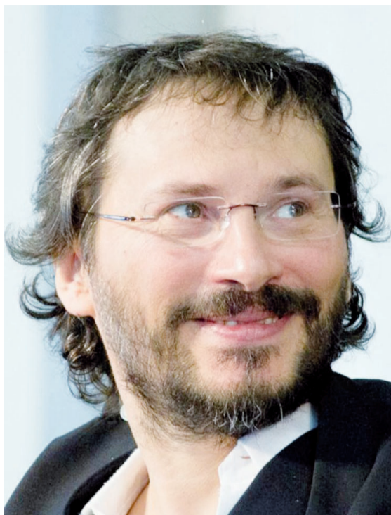
Il poeta Pierluigi Cappello