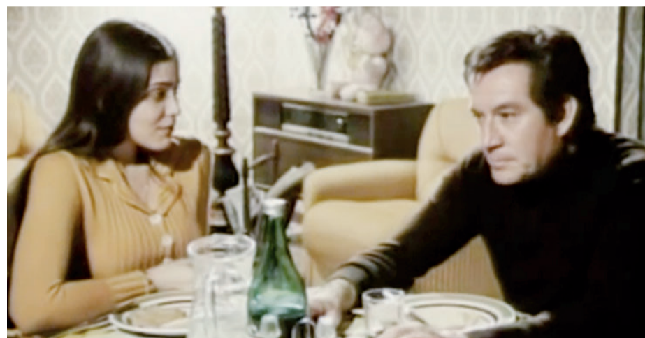
Ugo Tognazzi nel film "Romanzo popolare" sarà proiettato il 22 agosto in Largo San Giorgio

LARGO SAN GIORGIO Nell'arena di Largo San Giorgio continua, invece, la programmazione di "Cinema sotto le stelle" (ore 21): questi i film in programma fino al 31 agosto. La novità "Thor: Love and Thunder" di Taika Waititi sarà proiettata il 17 agosto. Il 19, invece, toccherà a "The French Dispatch" di Wes Anderson. Lunedì 22 agosto serata omaggio a Ugo Tognazzi